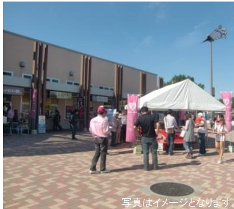
写真はイメージとなります。