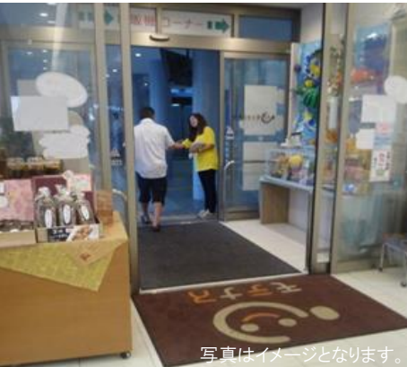
写真はイメージとなります。