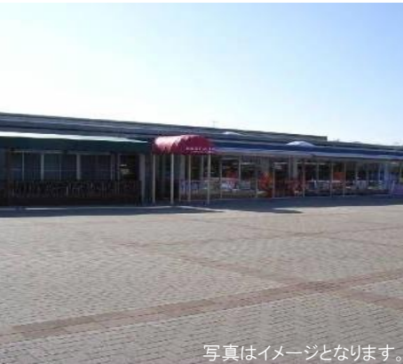
写真はイメージとなります。