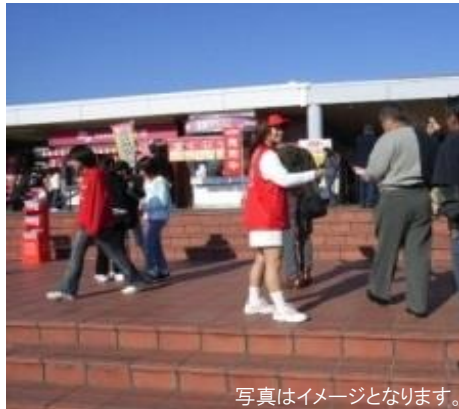
写真はイメージとなります。