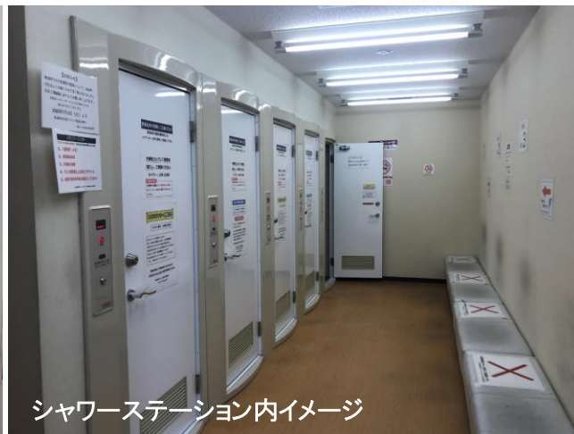
シャワーステーション内イメージ