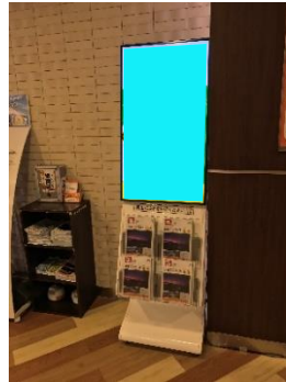
NEXCO中日本 守谷SA Ⓧ