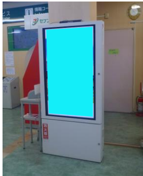
NEXCO東日本 三芳PA Ⓧ